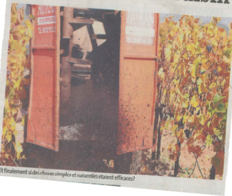
Et finalement si des choses simples et naturelles étaient d'accès ?