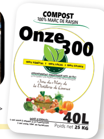
Petits sacs de 40L >