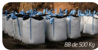
BB de 500 Kg

La saison bat son plein. Plus de 500 T vendues ! La coopérative prolonge jusqu'au 31 janvier 2017 son offre de lancement petits sacs, BB et vrac (+5% de produits gratuits). Contact : claire.salvat.cavale@outlook.fr