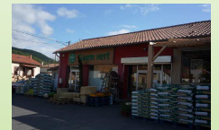
Le GAMM VERT de Quillan