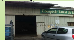
Comptoir de village à Mouthoumet et à Couiza