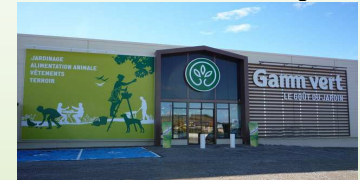
Le GAMM VERT de Limoux