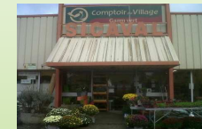
Comptoir de village à Belvèze